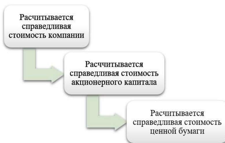
Рис. 1 – Алгоритм расчет справедливой стоимости

Рассчитанная внутренняя справедливая стоимость, отражает финансовые показатели деятельности компании. Такая фундаментальная стоимость является величиной достаточно устойчивой, чего нельзя сказать о рыночных котировках, алгоритм расчета справедливой стоимости представлен на рисунке 1.