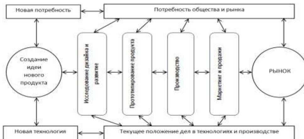
Рис. 1. Интерактивная модель инновационного процесса

Зачастую бывает довольно сложно определить первый шаг к созданию конечного продукта. В таком случае применяется интерактивная модель инновационного процесса, которая включает в себя как новые технологии, так и потребность рынка. Данная модель представлена на рисунке 1.