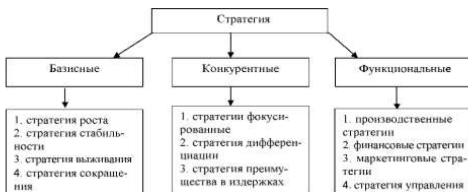
Рис. 1. Классификация стратегий

Выделяют следующие виды стратегии, которые представлены на рисунке 1.