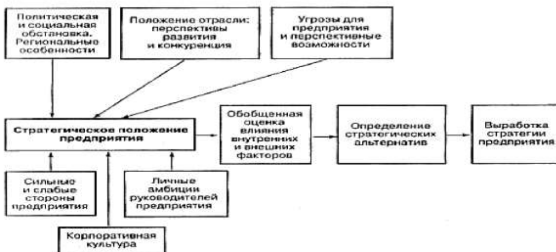
Рис. 2. Этапы выработки стратегии предприятия

Этапы выработки стратегического плана выглядят следующим образом [2, с.90]: