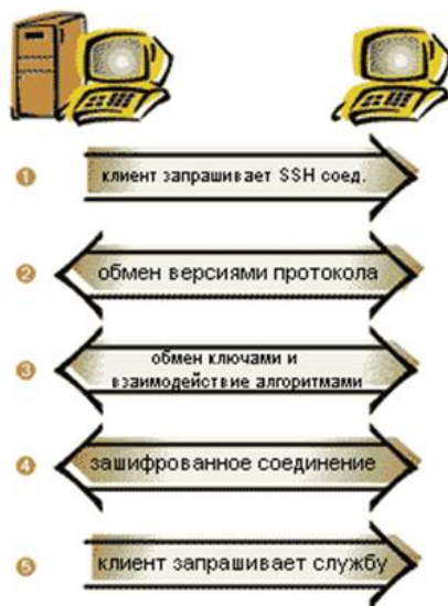
Рисунок 1 алгоритм работы протокола SSH-1

Ниже на рисунке 1 дано описание работы протокола SSH-1: